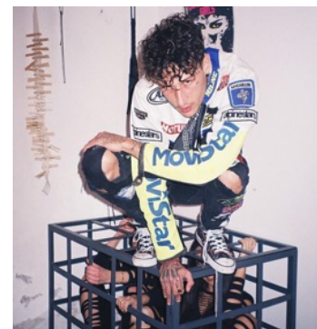
Yung Beef.

vitales, sus problemas con la medicación y con la drogadicción, sus desordenes mentales representados en la utilización sistemática de contrastes entre opuestos, etc. El artista concibe este tema como un último recurso a partir del cual conectarse líricamente con un mundo del que ya no se siente parte. El análisis discursivo y metafórico de “Ready Pa Morir” es el objetivo principal de este póster, cuyo propósito es examinar el potencial del medio artístico como válvula de escape de carácter bidireccional.