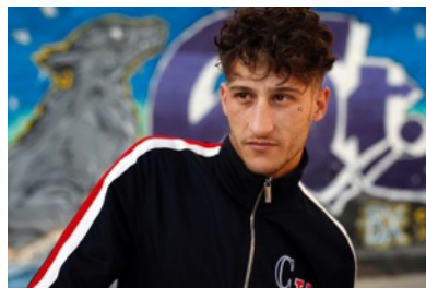
Yung Beef.

el reguetón y el rap, fusionando y coordinando influencias externas que van desde el flamenco más «ortodoxo» al trap americano.